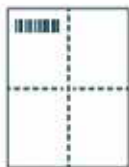
Étape 1 Step 1